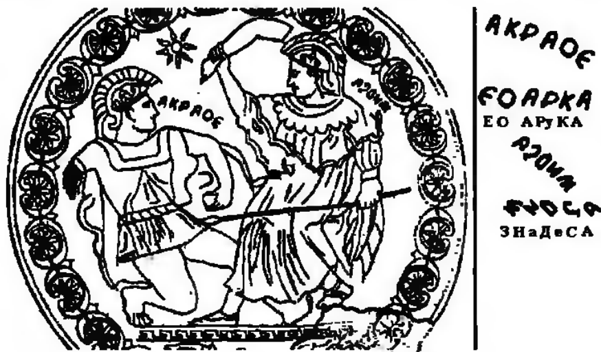
Рис. 55а. Зеркало со сценой отрубания руки